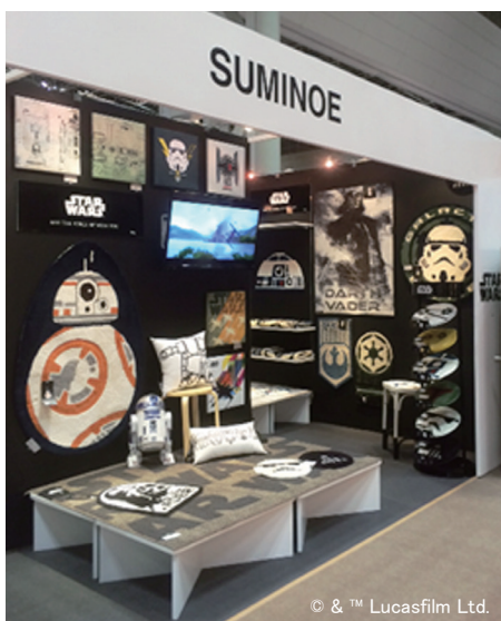
新作「スター・ウォーズ」(2015年12月発売)

今回スミノエブースでは、昨年12月に新発売の「スター・ウォーズ」をメインに、「デザインライフ edition.9」や「コルネ」を展示いたしました。